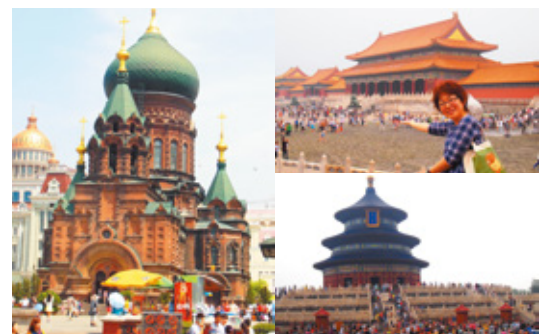
左)ハルビンのシンボル、ロシア正教の教会・聖ソフィア大聖堂。ロシア人によって開拓されたこの街は、西洋の空気が漂う雰囲気ある街でした。しかし、北京での乗り換えを含め9時間は遠かった! 右上下)15年ぶりの故宮と初の天壇公園。どこに行っても人・人・人! 庶民の経済力が上がり国内外で旅行ブームの様相。

に感激! その「厚意に感謝しつつ、私たちが一人でも多くの赤ちゃんが授かるように頑張ることが何よりの恩返し!」と気持ちを新たに帰路につきました。