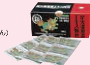
星火温胆湯 (せいけうたんとう)